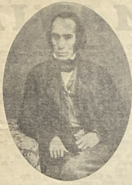
"SCRIU CÂND MOARTEA MUSCĂ DIN MINE" NICOLAE BĂLCESCU 1830

... "Văzurăm într-o zi soarele strălucitor al libertății a se nălta și cu razele sale fierbântătoare a învia pământul; și îndată iarăși a se întuneca și în mijlocul acestei întunecimi a ne asvârli departe de patria noastră..."